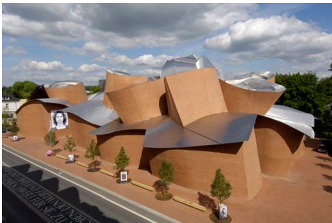
Museum MARTa Herford